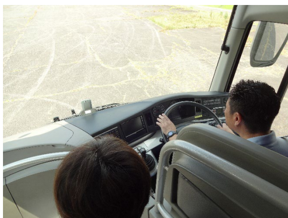
添乗指導者を乗せての実技指導